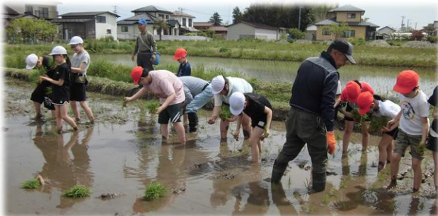
「田んぼの会」、「みどりの会」の皆様のご協力をいただきながら、5年生が田植え活動に取り組みました。